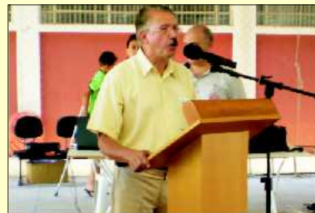
Presidente Ellery durante discurso de abertura do evento