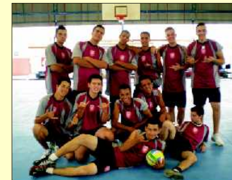
Equipe masculina de Rio Claro