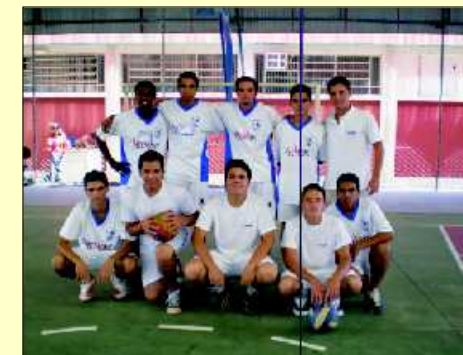
Equipe masculina CAMPL - Limeira