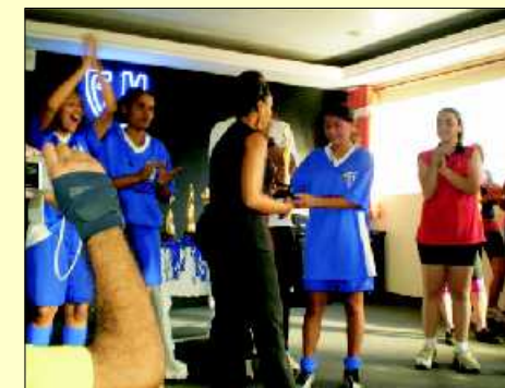
Entrega dos troféus e medalhas às equipes vencedoras

CAMPL - Círculo de Amigos do Menino Patrulheiro de Limeira - SP PROBEM - Programa do Bem Estar do Menor - Uberaba - MG AEHDA - Associação de Educação do Homem de Amanhã de Araras - SP