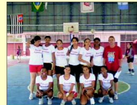
Equipe feminina de Uberaba