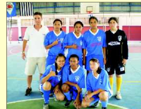
Equipe feminina CAMPL - Limeira