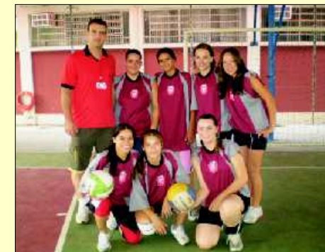
Equipe feminina de Rio Claro