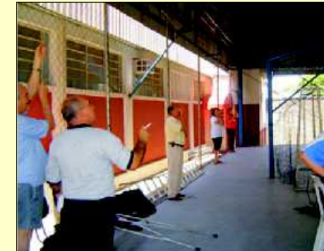
Hasteamento das bandeiras