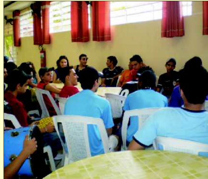
Abertura do evento e execução do hino Nacional, hino de Rio Claro e a confraternização das equipes