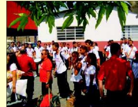
Momento da chegada das entidades