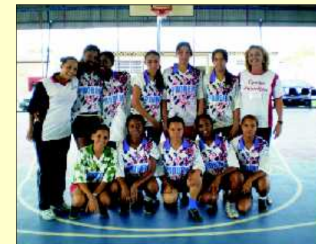
Equipe feminina PROBEM - Uberaba