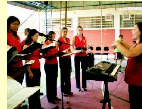
Coral "Encanto Jovem" da GMRC